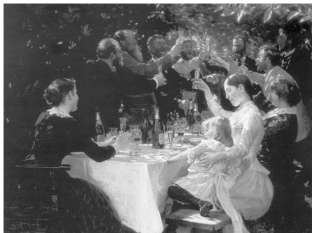
Le déjeuner des artistes scandinaves, Krøyer (1883) Musée de Skagen.

Cette tablée printanière me fait penser au Crémant de Bourgogne .