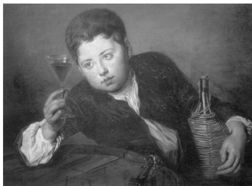
Le Dégustateur par Philippe Mercier (1689-1760) Musée du Louvre

Pour les rouges, ceci est à nuancer. Nous avons pourtant rapidement eu à vinifier du raisin rouge par l'arrivée sur le domaine de notre parcelle de Gamay. Seulement, elle représentait une portion très faible de notre production et nous n'avions pas une ambition folle pour ce