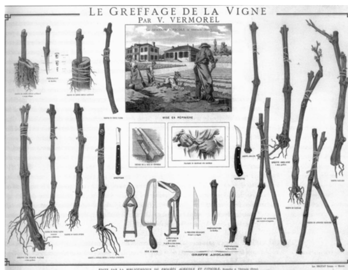
Le Greffage, Victor Vermorel Maison du Patrimoine, Villefranche sur Saône.

Dans les soins qu'on lui prodigue en vue de ce beau résultat, on opère un rude découpage et un assemblage quelque peu arbitraire avec un autre morceau de bois de vigne, comme on le voit sur la planche ci-dessous, qui n'illustre pas notre procédé car il s'agit ici de pratiques anciennes. Aujourd'hui, un instrument découpe les extrémités comme deux pièces de puzzle, en forme d'oméga ( \Omega ). Ensuite seulement ce fragile assemblage est bichonné : tourbé, mis au chaud, surveillé de près, comme des nourissons dans une pouponnière ! Et, finement, humblement, généreusement, la vie est là, malgré notre maladresse.